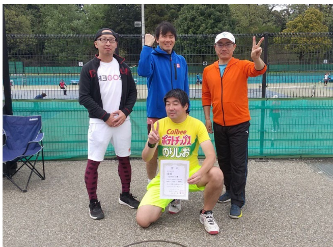
初中級男子 優勝 TEPPEN C