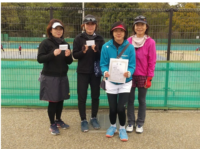
初中級女子 優勝 AKASO