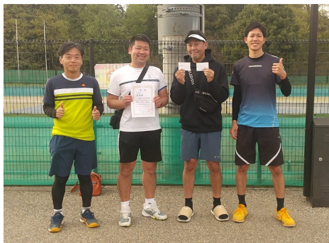
一般男子 準優勝 B.Sチーム芹沢