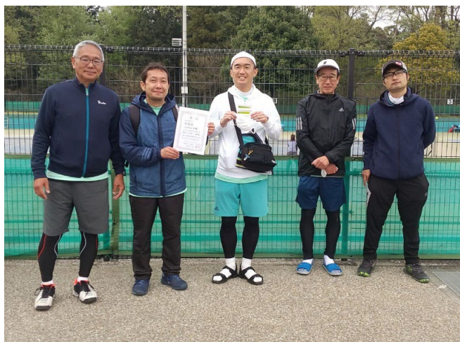
初中級男子 準優勝 TEPPEN B