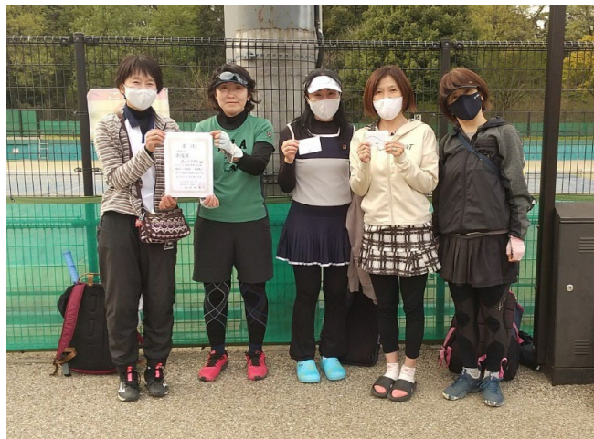
一般女子 準優勝 森のくまさん