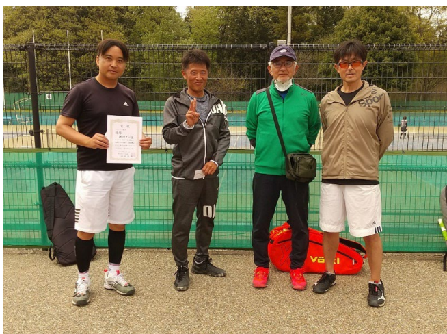
ベテラン男子 優勝 絶対タン塩