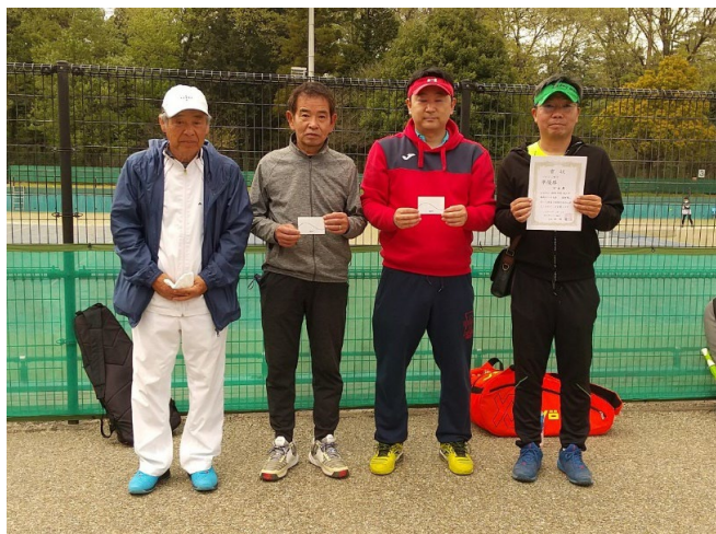
ベテラン男子 準優勝 ブレ月