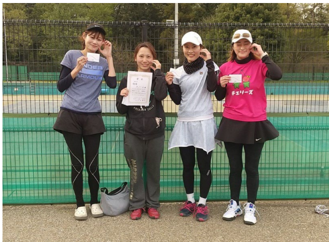
一般女子 優勝 チェリージョ