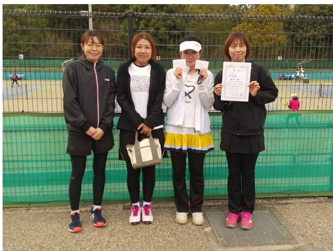
初中級女子 準優勝 混成チーム(仮)