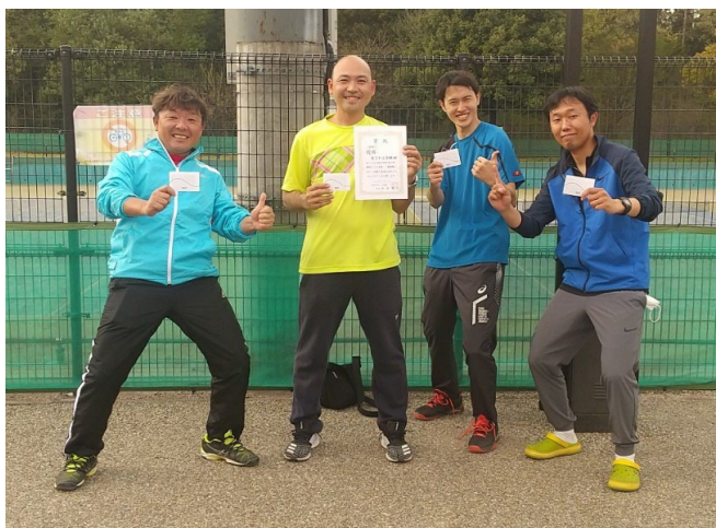
一般男子 優勝 B.Sチーム古城