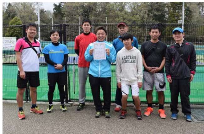
準優勝 Bone Setter