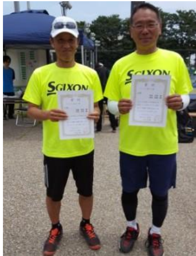
3位 福島/岡部(杉山組/杉山組)