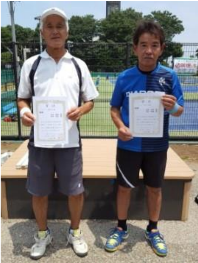
優勝 清水/岡本(月見野/月見野)