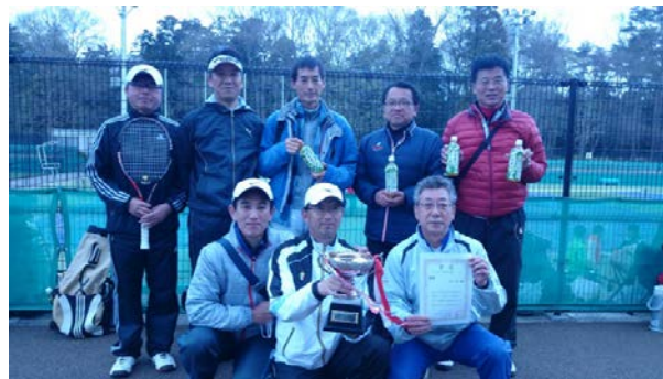
優勝 フリーザ (ブラック)