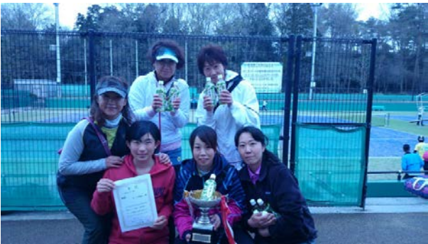
優勝 チーム天晴れ (月見野)