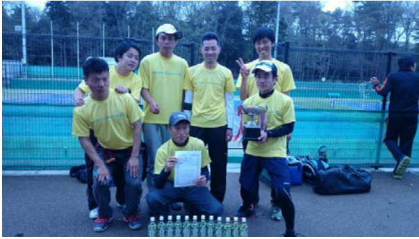
優勝 T's (T's)